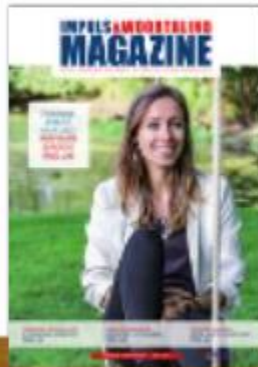
IPWB 2 - 2021