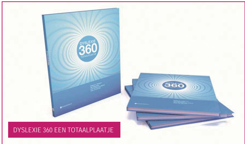
DYSLEXIE 360 EEN TOTAALPLAATJE

'Dyslexie: Stoornis of Intelligentie' (2012). Ook zij stellen dat dyslexie een andere manier van informatieverwerking is. Maar ze trekken het iets breder en noemen het conceptueel denken, waarbij een persoon vooral vanuit associaties, beelden of verbanden denkt. De taalverwerking bij dyslectici verloopt daarmee anders dan bij niet-dyslectici, maar dat is geen stoornis. Het is een andere manier van denken die veel kwaliteiten biedt.